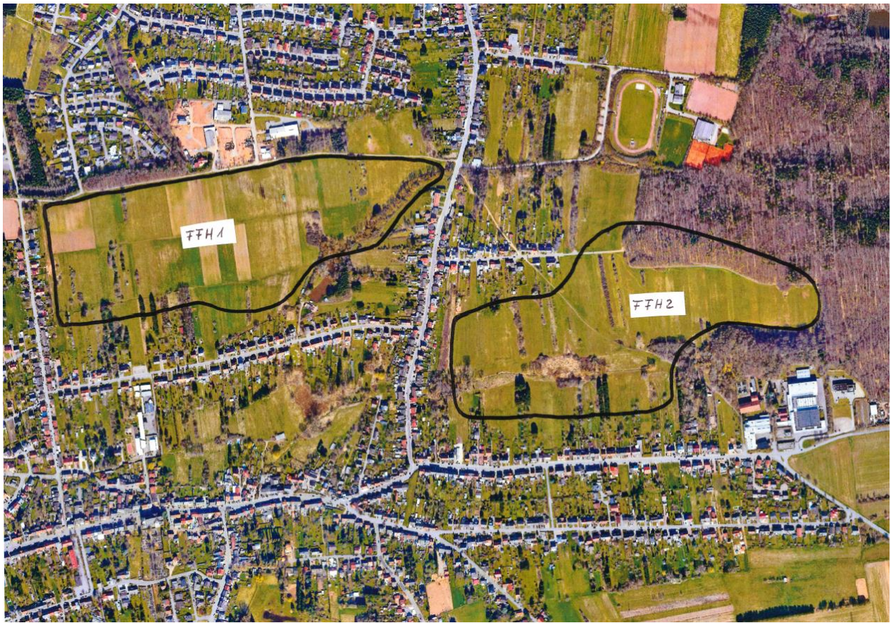
Abbildung 1 Ruhige Gebiete in der Gemeinde Schwalbach